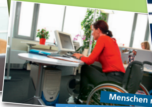
Menschen mit Behinderung integrieren